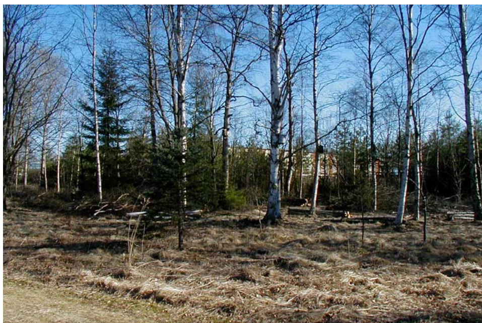
Vy från kv Liljekonvaljen mot kv Myran

Även för industritomten Myran 1 är det befogat med störningsskydd eftersom detaljplanen medger tyngre form av industri. I miljökonsekvensbeskrivningen anges att vall och plank är likvärdiga som insyns- och bullerskydd. Detaljplanen redovisar bullervall inom skyddsområdet norr om kvarteret Myran. Denna vall sammanbinds norrut med vallen vid kvarteret Flugan.