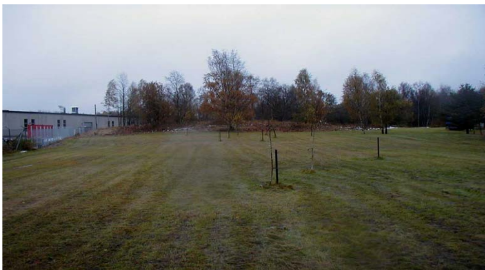
Vy från norr mot grönområdet öster om kv Flugan

Nuvarande grönområde mellan kvarteret Älggräset och kv Flugan består av en kulle med blandade lövträd såsom björkar, fruktträd m m. Inom detta område låg tidigare fastigheten Göransberg med ett bostadshus. Bostadshuset låg på kullen väster om kvarteret Flugan. Huset revs i början av 1990-talet. I övrigt är området täckt av högt gräs och buskvegetation. Kullen kan ses som ett naturligt skyddsområde mot industriområdet. Grönområdet mellan kv Liljekonvaljen och Myran består av högvuxen blandskog med både barr- och lövträd samt på sina håll relativt tät.