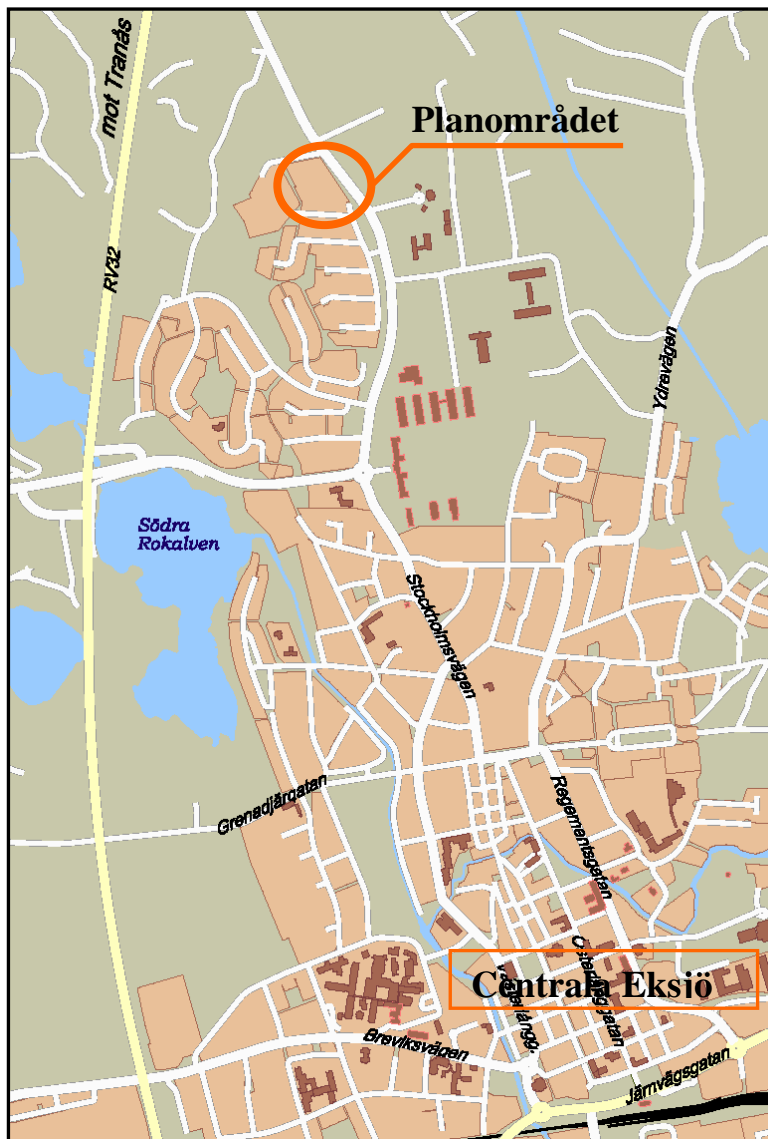
Planområdets läge i staden