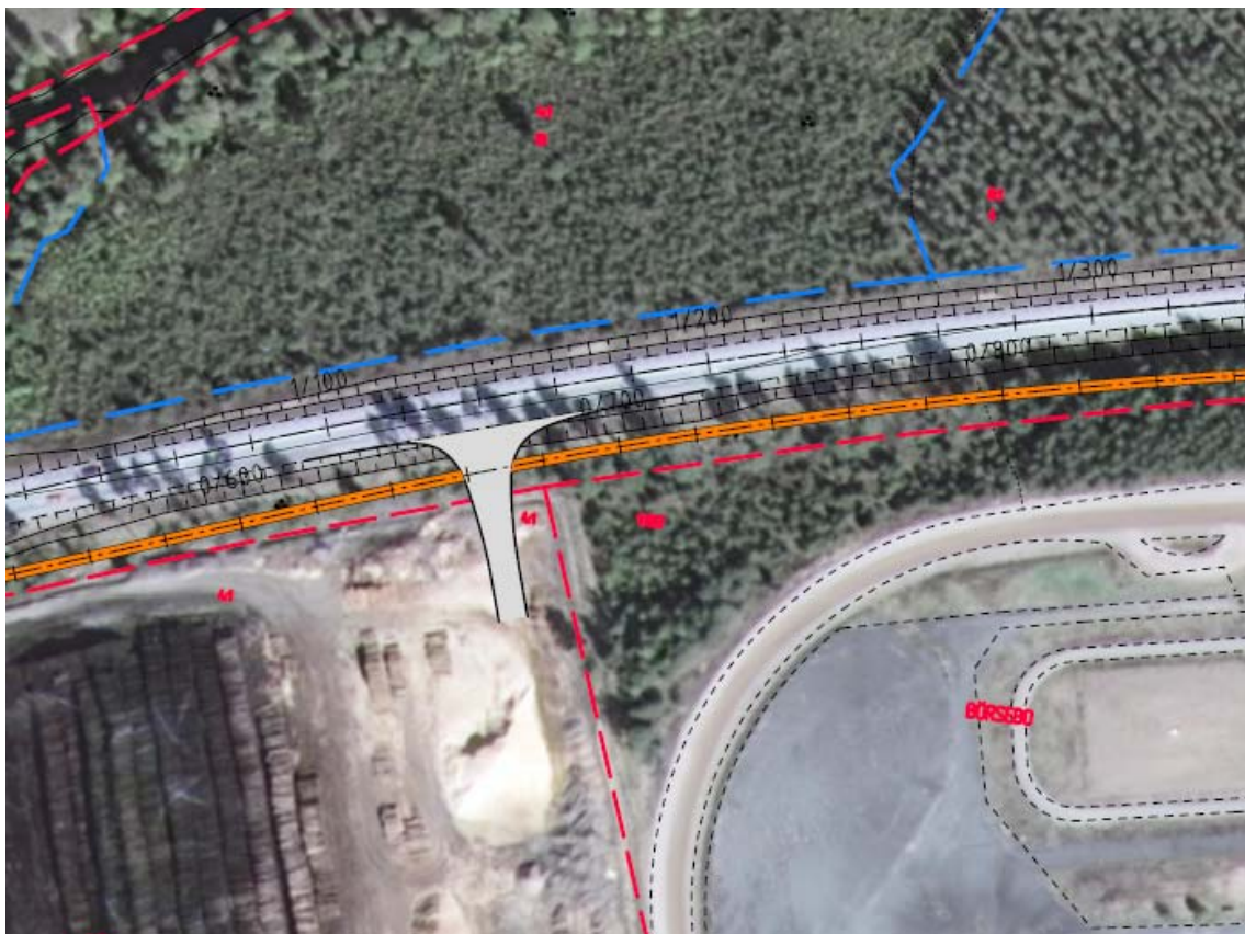
Ny utfart från VIDA Bruza till väg 40. Bild från vägplanen.