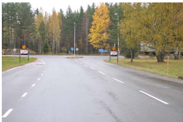
Korsningen väg 40/väg 895

Den befintliga infarten till sågverket stängs och en ny infart anläggs längre österut (ingår ej i denna plan). Storgatan avslutas med en vändplan längst i öster. Den väg som i gällande detaljplan benämns Ryssebovägen ersätts med användningen J 1 (Icke störande industri/verksamhet) och NATUR. Inom kvartersmark J 1 ska angränsning till fastigheten 1:323 lösas genom g, gemensamhetsanläggning.