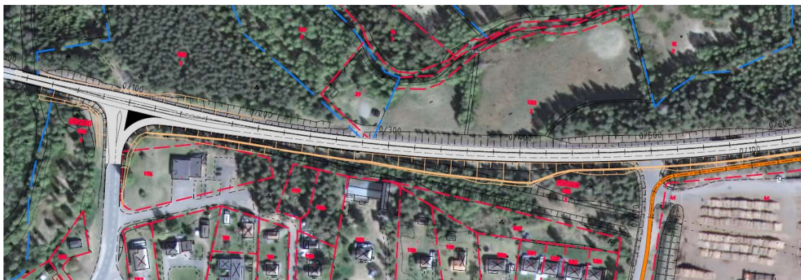
Åtgärder längs med väg 40. Bild från vägplanen.