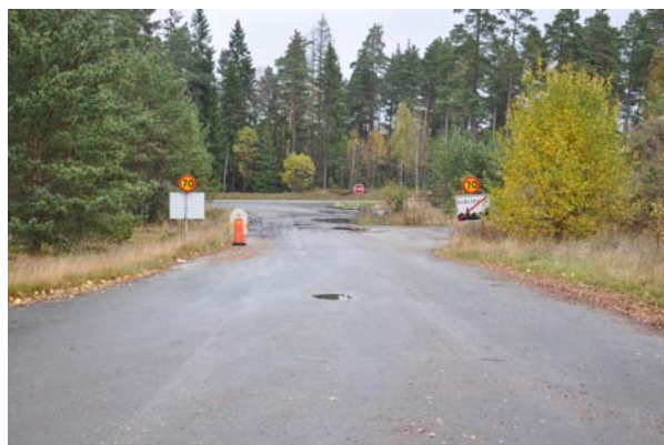
Befintlig anslutning till väg 40 stängs