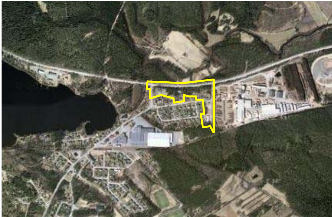
Planområdets läge och avgränsning