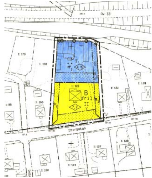
Utsnitt ur gällande detaljplaner BPL 562 samt DP 564