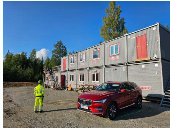
Platskontoret för vindkraftpark Bruzaholm.