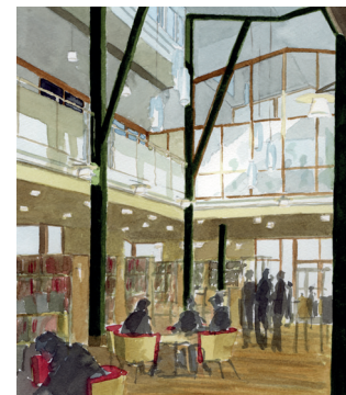
Akvareller: Lasse Samuelson