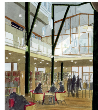
Akvareller: Lasse Samuelson