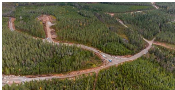
Väguppbyggnad i området för vindkraftpark Bruzaholm.

Nästa steg blir att fortsätta arbetet med vägnätet. Arbetet med att gjuta fundament kommer även påbörjas. Innan året är slut kommer ca 4-5 avjämningar att göras.