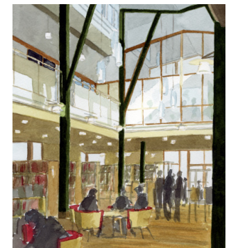
Akvareller: Lasse Samuelson