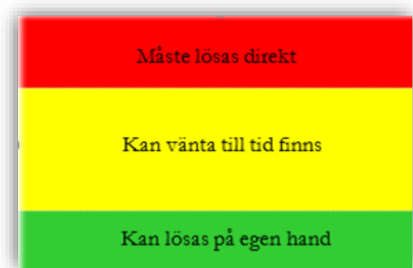
Figur 2 Konfliktsskalan